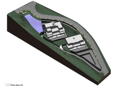
3D Plano Area 3D (m2)